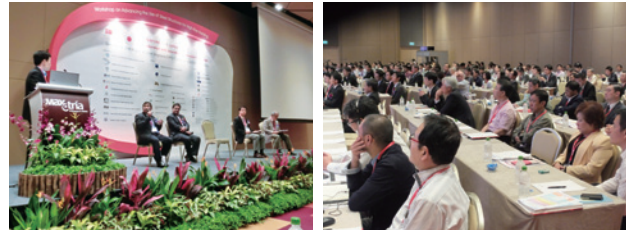
図3 セミナー会場の様子