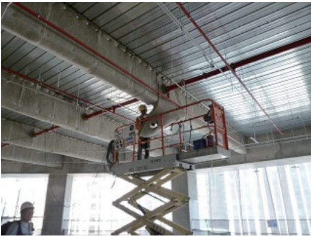
図2 シンガポールでのMAKIBEE™施工風景

「マキベエ®」は、あらかじめ工場で成形された耐熱被覆材を鉄骨に巻き付け、ピン止めするという比較的容易な作業で施工ができること、吹き付け被覆材のように作業中に他の作業が中断することなく並行作業が可能であることが、工期短縮やコストダウンにつながるということで、建築における合理的な新技術として認められ、「MAKIBEE™」の名で初の海外での採用に至りました。