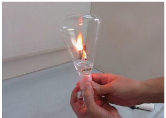
図1 燃焼フラスコ法による前処理の様子

有機物中のリンや硫黄，塩素を定量する際の検液調製法として用いられることが多い。しかし、ふっ素系ポリマーに適用する際には、燃焼時に発生するガスがフラスコ内壁と反応し、ブランクが高くなることが予想され、また、ふっ素存在下での微量のリン，ホウ素の回収率が問題ないかなど、確認すべき課題が多い。このため、分析法としてふっ素系ポリマーに適用できるのか広く知られていない。当社では種々の検討を重ねた結果、ふっ素系ポリマー中の微量のリン，ホウ素の定量に燃焼フラスコ法を適用しても、上述の問題はなく、実試料にも充分適用可能なが判ったので、以下に詳細を述べる。