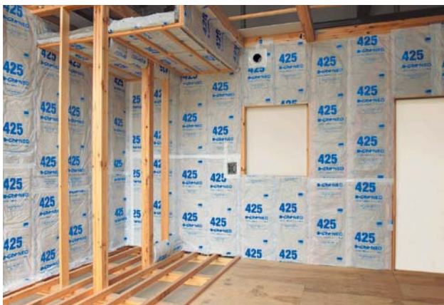
写真2 製品施工写真

またホームマット®NEOの厚みは、屋根、天井のトレードオフ (注1) に対応できる90mm厚、105mm厚をご用意しております(表1)。