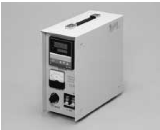
写真2 専用制御ボックス

助ヒータ（4kw）として使用する場合、汲み出し口内のアルミ溶湯量は300kg位が目安となる。