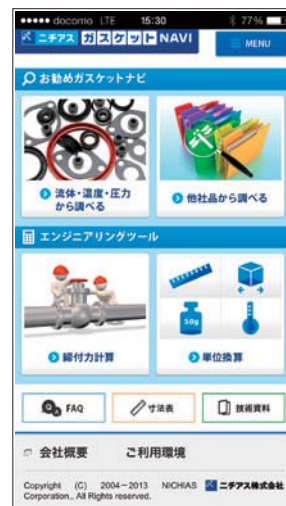
スマートフォン版