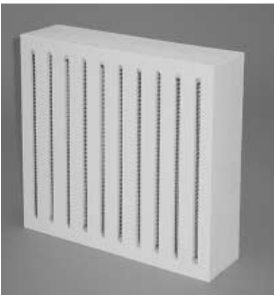
写真1 T/#5410-PH-SP (板状)