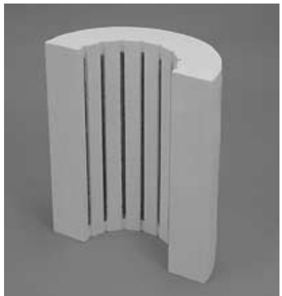
写真2 T/#5410-PH-SH (半円筒状)