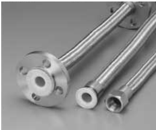
写真1 T/#9067-A ナフロンPTFE プライアブルホース

従来の T/#9067 ナフロンPTFE プライアブルホースに比べ、①柔軟性が向上した、②最小曲げ半径が小さくなった、③従来よりも長尺物の対応が可能になった、という3点の特長を有している。製品概要を以下に紹介する。